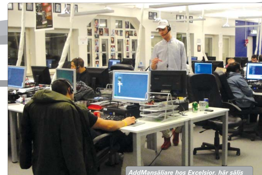
AddMansäljare hos Excelsior. Här säljs allt från IT-lösningar till TV-abonnemang

Vi ser behoven och i samarbete med dig som kravställare kan vi föreslå lösningar om vilken typ av personlighet, karaktär och profil som passar bäst till just er organisation.